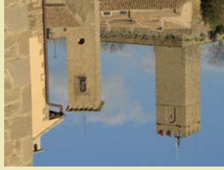
Sos del Rey Católico

SOS: Puntos de interés histórico-monumental: Iglesia y cripta de San Esteban (s.XI). Ermita románica de Santa Lucía (s.XII). Castillo y Torreón (s.XII). Judería; Palacio de Sada y Cl. Fernando el Católico; Ayuntamiento y Casa del Niño (s.XIV); Sanhuario de Valenñuama; Castillo de Roita (s.XIV); Torre de Añués (s.XIII).