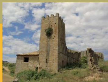
Torre de Añués