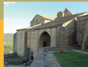
Sos del Rey Católico