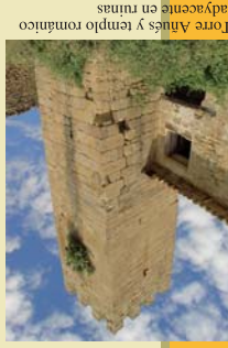
Torre Añués y templo románico adyacente en ruinas

SOS DEL REY CATÓLICO, VILLA AMURALLADA Y MEDIEVAL Sos del Rey Católico se localiza en una pequeña elevación de la Sierra de la Peña. Declarada Conjunto Histórico-Artístico Monumental, hoy BIC, es cabecera de las Altas Cinco Villas y conserva sus características de atalaya fronteriza entre los reinos de Navarra y Aragón. Sos reúne uno de los más bellos conjuntos arquitectónicos de Aragón, con excelentes muestras de románico y gótico. En sus alrededores podemos visitar el Convento de Valenñuama, la Torre de Añués, el Castillo de Roita, sus montes y frondosos bosques y pinares. TORRE DE AÑUÉS, ARQUITECTURA DISPERSA FORTIFICADA En la frontera entre Aragón y Navarra se asienta en un pequeño altozano la Torre de Añués, a la misma distancia