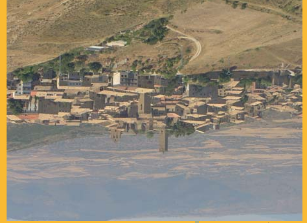
Sos del Rey Católico

SOS DEL REY CATÓLICO, VILLA AMURALLADA Y MEDIEVAL Sos del Rey Católico se localiza en una pequeña elevación de la Sierra de la Peña. Declarada Conjunto Histórico-Artístico Monumental, hoy BIC, es cabecera de las Altas Cinco Villas y conserva sus características de atalaya fronteriza entre los reinos de Navarra y Aragón. Sos reúne uno de los más bellos conjuntos arquitectónicos de Aragón, con excelentes muestras de románico y gótico. En sus alrededores podemos visitar el Convento de Valenñuama, la Torre de Añués, el Castillo de Roita, sus montes y frondosos bosques y pinares. TORRE DE AÑUÉS, ARQUITECTURA DISPERSA FORTIFICADA En la frontera entre Aragón y Navarra se asienta en un pequeño altozano la Torre de Añués, a la misma distancia