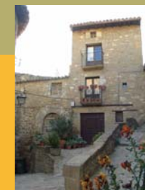
Sos del Rey Católico