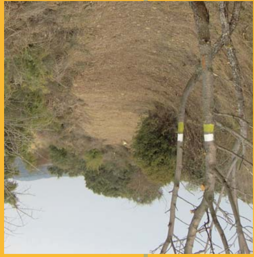
Marcas de GR en Orés

ASÍN: Puntos de interés histórico-monumental: Iglesia parroquial y románica de Santa María (s.XIII). Ermita de la Virgen del Campo. Caserío tradicional monumental, con casas de piedra y portadas abovedadas. Restos del molino de viento de la localidad. ORÉS: Puntos de interés histórico-monumental: Iglesia parroquial de San Juan Bautista (s.XII – XVII). Conjunto monumental de origen medieval. Restos de la antigua fortaleza – monasterio. Ermita de la Virgen del Verzal. Ermita de la Virgen de la Perdina. Ermita de San Jerónimo.